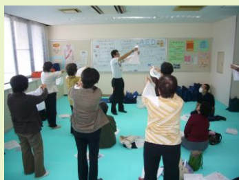
「救急法・心のケア」

講座では、災害時に被災者の生活や自立を支援する災害ボランティアの活動やその活動を支える災害ボランティアセンターについての説明や、災害に対する地域の防災力の強さ・弱さを再認識し、今後の防災に対してどのように対応していく必要があるのかを地図を使って話し合うDIG（図上訓練）などを行いました。