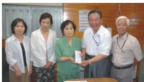
立正佼成会鹿兒島教会始良支部