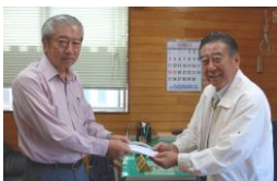
始良市ゴルフ協会