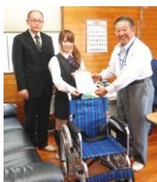
株式会社木村商事

勝手ながら敬称を略させていただきます。非掲載希望の欄には(一)を表示させていただいています。