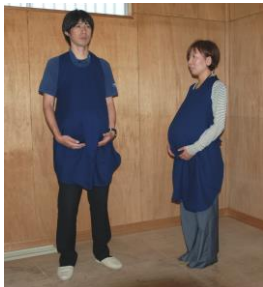
(写真左) 高齢者疑似体験 (写真右) 妊婦体験