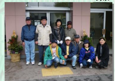
手をつなぐ育成会の皆さん