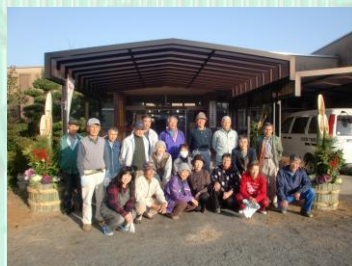
竹細工教室の皆さん