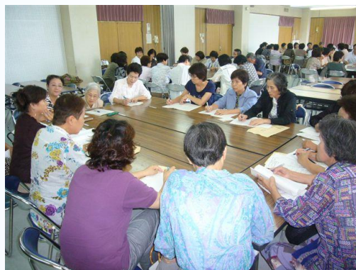
グループ学習の様子

参加者は、それぞれのサロンの活動状況や運営に関する意見など活発な意見を交換し、お互いの交流を深めました。