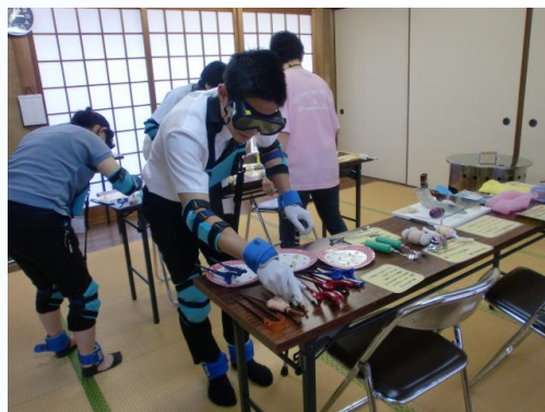
高齢者・障がい者疑似体験の様子

参加者からは「子どもたちに伝え、指導すべき立場なので、まず教師自ら研鑽する必要性を感じた。」との感想をいただきました。