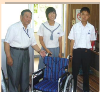
車椅子寄贈(蒲生中学校にて)

勝手ながら敬称略とさせていただき、非掲載希望の欄には(一)を表示させていただいています。