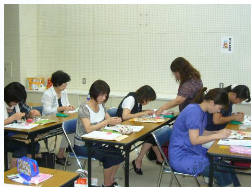
手ぶくろ人形を作成している様子

県防災研修センターにおいて保育サポーター養成講座を開催しました。「子どもが大好き」、「子育て中のママさんたちの役に立ちたい」、「社会参加をしたい」、そんな思いをお持ちの方11名が受講されました。子どもの発育や発達、看病や手当での仕方など熱心に学ばれました。今後、育児で悩むママさんたちにとって心強い保育サポーターとして活躍されるでしょう。