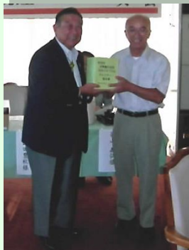
始良市ゴルフ協会

5年間にわたり全校生徒でアルミ缶回収による資金集めを行い、今回車椅子を購入。「車椅子を必要としている方々に利用して欲しい」と寄贈して下さいました。