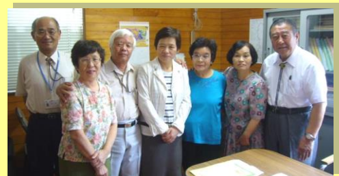
立正佼成会加治木支部のみなさん

始良市民チャリティーゴルフ大会で募金活動を行い、地域福祉活動推進の為のご寄付をいただきました。