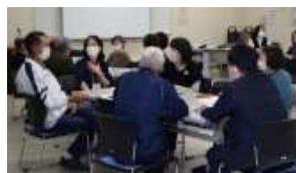
◀ 病院、施設の方を交えて交流と意見交換

参加者からは、「病院、施設の方と直接話ができてよかった。」「自分にできるボランティア活動をしていきたい。」との感想がありました。