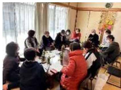
▲ 毎月1回開催のネットワーク会議