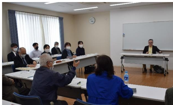
▲年に数回、専門機関が集まり、関係機関との相互連携や中核機関の取り組みについて協議しています

市成年後見支援センターにはこの1年で217件の相談が寄せられています。今後は相談から制度につながった事例や関係機関と連携した事例などを分析し、後見人の受任者調整にも取り組んでまいります。