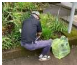
▲ 室内の簡単な清掃