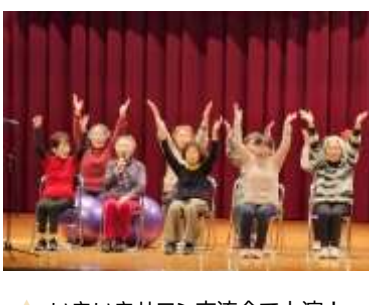
▲ いきいきサロン交流会で上演！ 演劇 めざそう！健康長寿「ある日のできごと」