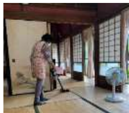
▲ 室内の簡単な清掃