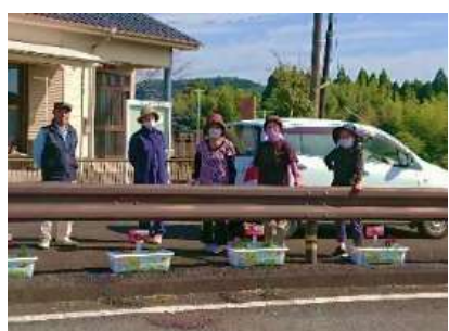
▲ 公民館や学校の周りを花いっぱい