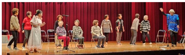
▲サロン劇：健康長寿「ある日のできごと」