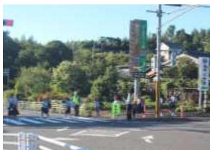
▲ 始良っ子見守り隊として登下校の見守

竜門校区の「竜門わくわくサロン」は、健康体操や楽しいゲーム等を通して和気あいあいとした時間を過ごしています。1年前に、交流会で皆さんに楽しんでもらえるような劇を披露したいとの申し出があり、今年2月開催の「ふれあいいきいきサロン交流会」で上演していただきました。このメンバーには地域活動に積極的に参加される方が多く、高齢者クラブの西元寿会や花いっぱい運動・小学生の登下校の見守りをする始良っ子見守り隊もいらっします。