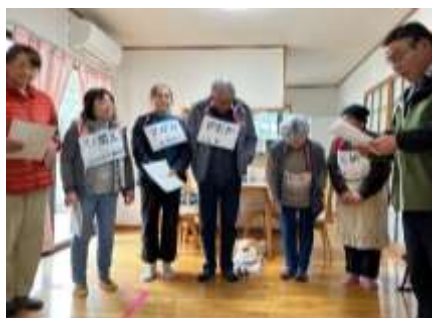
▲ 演劇「とめばあちゃんの味噌汁」の練習風景

※オレンジカフェ…認知症の方やご家族、地域の方や専門家が集まり、交流を楽しんだり悩みを相談したりする場所