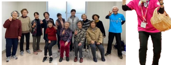
サロン担当も劇に特別出演▲