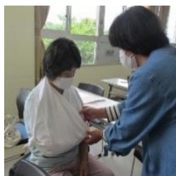
▲三角巾を使って実際に体験する会員の皆さん