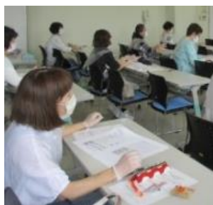
ビニール袋で作る「簡易エプロン」▲