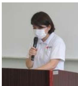
▲「小児看護の基礎知識」について