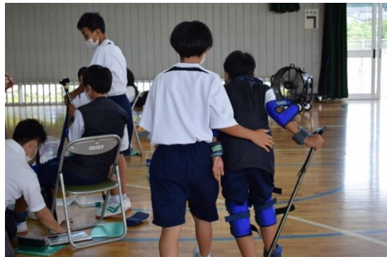
▲新たに高齢者疑似体験セット 28 セット（J A あいら様寄贈）が加わりました