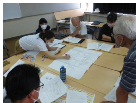
▲寸劇シナリオの地域の情報を書き込んでいる様子

始めに SC※1 から地域の支え合いの有用性について説明を行い、次に県社協のご近所支え合いマップセンターの職員から「マップづくりのイロハ」を教えていただきました。講義後は、寸劇シナリオ※2 を使用しての模擬体験を行い、課題解決に向けてみんなで意見を出し合いました。参加者からは「寸劇シナリオが良かった。」「ぜひ地域でも取り組みたい。」といった声がありました。自治会などへの支え合いマップづくり講座（出前講座）もできますのでお問い合わせください。