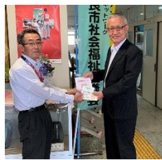
▲(公財)日本公衆電話会鹿児島支部様よりマスクとポケットティッシュのご寄付を頂きました