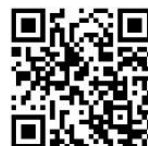
申込フォーム QRコード

※電話・メールで申し込みされる場合は、 「氏名・住所・連絡先」をお知らせください