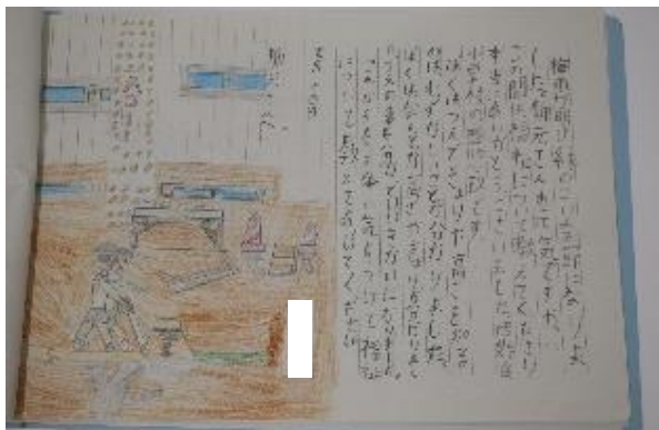
▲児童からのお礼のお手紙

7月7日に西始良小学校にて4年生の疑似体験学習がありました。高齢者・車いす・視覚障がい者の疑似体験を行い、支援する側と支援を受ける側に分かれ、それぞれ『自分にできることは何か』ということを考えてもらいました。また、体験を行った児童全員から感想文を頂きました。素晴らしい感想文をありがとうございました。