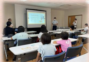
8/6 「かんたん法律教室」