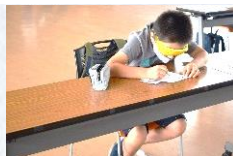
▲視覚障がい者体験

福祉体験（高齢者疑似体験・視覚障がい者体験・妊婦体験・車いす体験）と車いすに乗りながらユニバーサルデザインを探すユニバーサル探検を行いました。