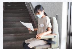
▲ユニバーサル探検