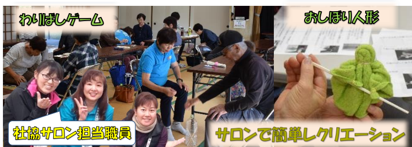
社協サロン担当職員