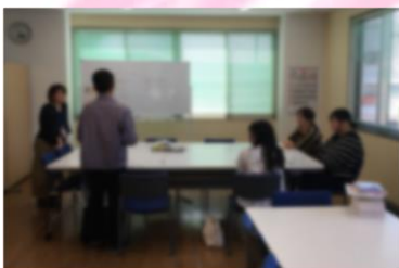
▲コミュニケーショントレーニングの様子