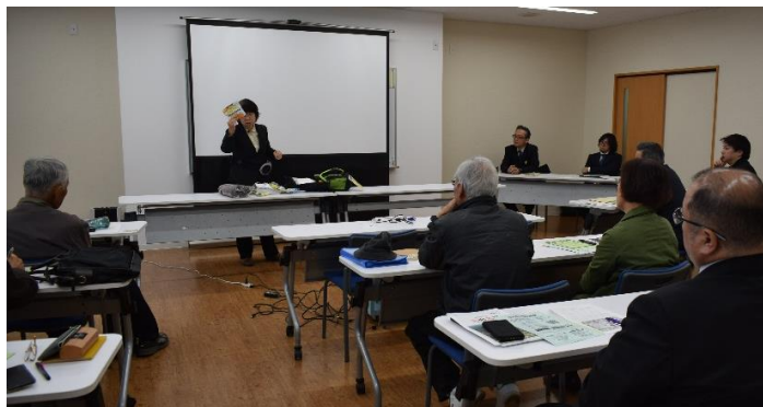
▲講座のようす（非常持ち出し品のチェック）

また、県外のボランティアセンターでの取り組みなども報告があり、災害が発生したときに地域のみなさんとできることを改めて考える機会となりました。