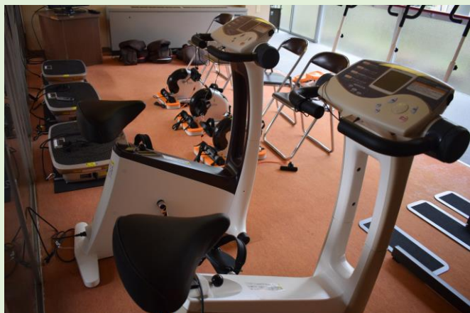
蒲生地区の健康と福祉の向上へいただいた寄付により整備したものです。