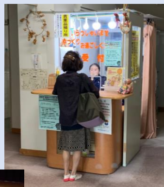
↑ 始良高齢者福祉センターにて、温泉の受付でお客さんと楽しそうに会話を する学生

5月14日から3日間、 重富中学校から2名が職場 体験に来てくださいました。 「働くことは大変だけど、 福祉について知るいい機会 になりました。」と感想をもらいました。