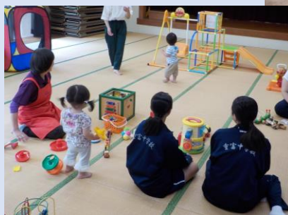
← かも子育てサロンで子ども達と一緒に遊ぶ学生