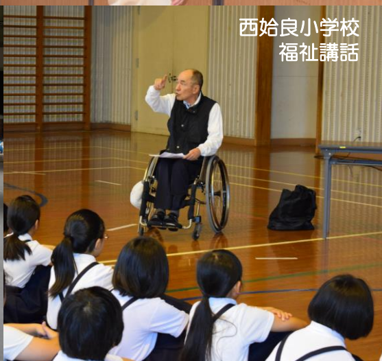
西始良小学校 福祉講話