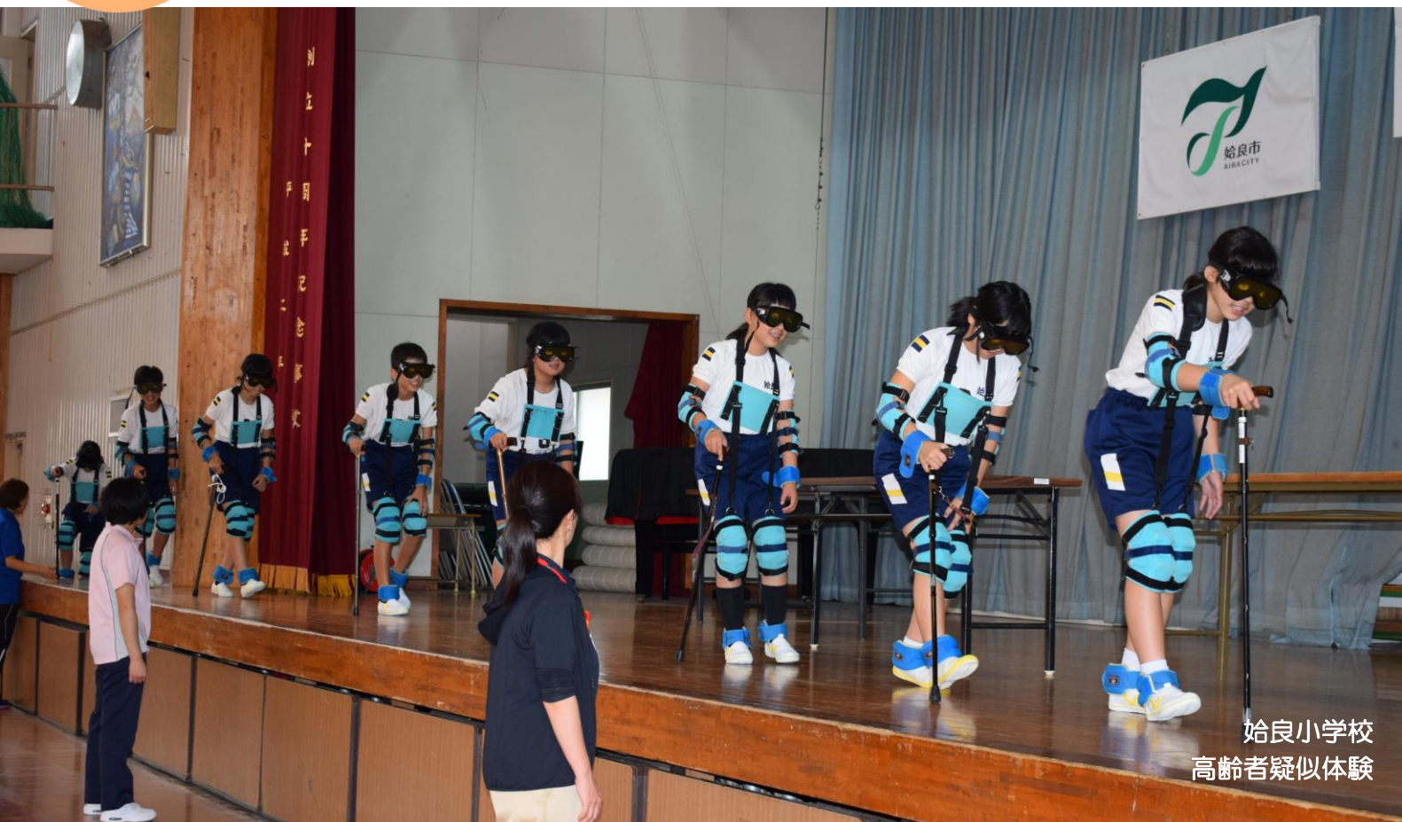
始良小学校 高齢者疑似体験