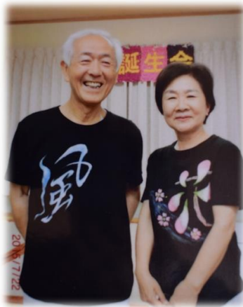
ご主人がデザインしたTシャツを着て活動中

※学校管理下の活動を除く、地域社会や個人・団体の福祉の増進につながるボランティア活動が対象になります。