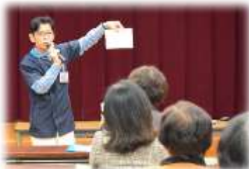
▲ふれんど薬局 あなたの健康見守り隊