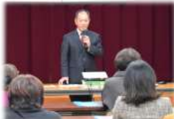
▲特別養護老人ホーム 大楠苑