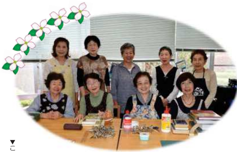
▼このコーナーでは私たちの街のボランティアを紹介します。

市立図書館開館当初から活動を始め、今年で21年目を迎えました。始めきっかけは、「本が大好きだから」「何かボランティアをして人の役に立ちたいから」など様々です。 1日の修理冊数約60冊。絵本の修理をしている時は、またこの絵本を子どもたちが手にしてくれると嬉しい、大事に読んでほしい、と思いながら作業をしています。また、仲間たちに会えるのも楽しみのひとつ。作業しながらおしゃべりをして、終了後にはお茶を飲んで「また次回会いましょう」とお互いに元気とパワーをもらっています。 図書館を利用するたくさんの方々が、それぞれ好きな本を手にして、大切に読んでいただけるよう、これからも楽しく活動が続けていきたいと思っています。