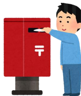
事務手続きのお手伝い