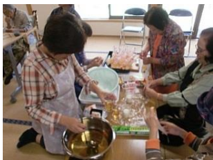
皆でお米を詰めました。