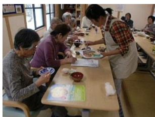
温ったかご飯と即席味噌汁、缶詰を頂きました。