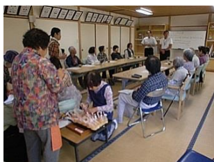
ご飯が炊けるまで防災講話でお勉強。