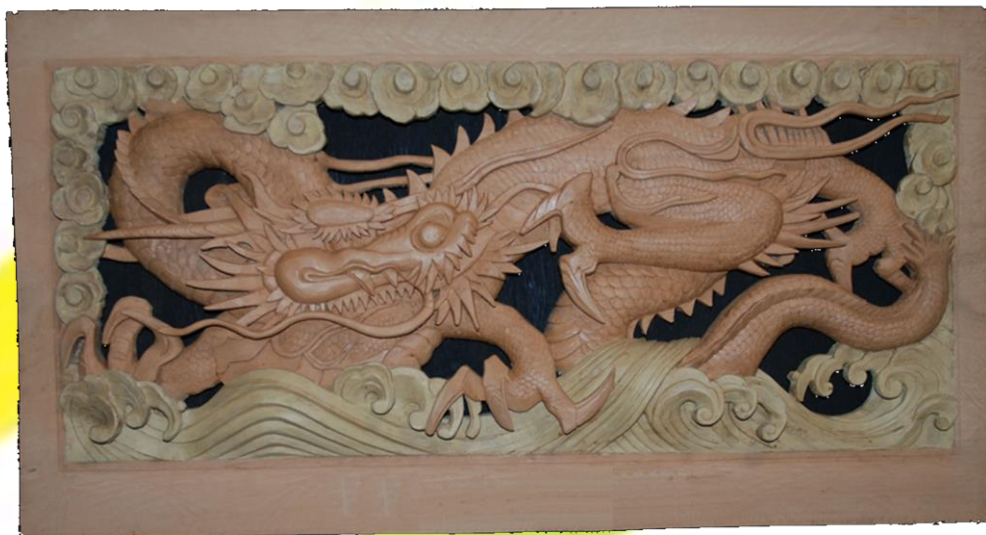
彫 刻 「龍の戯」 川平明博(81)