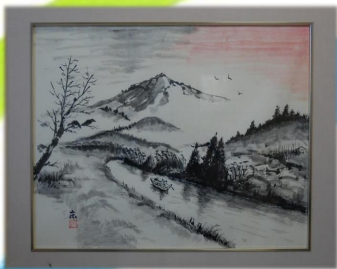
日本画 「水郷の黄昏」 東 正利(80)