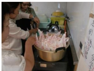
サロンで使用する大鍋で炊きました。

10月20日、サロンさわやか（蒲生地区）が非常炊出し訓練と防災講話を行いました。炊出しは、初めての事に、迷いながら袋（ハイゼックス）にお米とだし汁を入れる作業を行いました。普段、煮しめなどを煮込む大鍋で米を炊き、炊いている間は市危機管理課防災係の方から防災についての講話を頂きました。終了後、温かい炊出しと、即席みそ汁、非常食の缶詰を試食しました。「思ったよりも美味しい」と自分で詰めたご飯を美味しく頂くことができました。「何でも経験をする事が大事である」と良い経験になったようです。 初めての試みでしたが、ホットケーキミックスで『蒸しパン作り』にも挑戦しました。少し不思議な感じに出来上がりましたが、「こんな物も作れるんだ」と感心しながら楽しい訓練となりました。