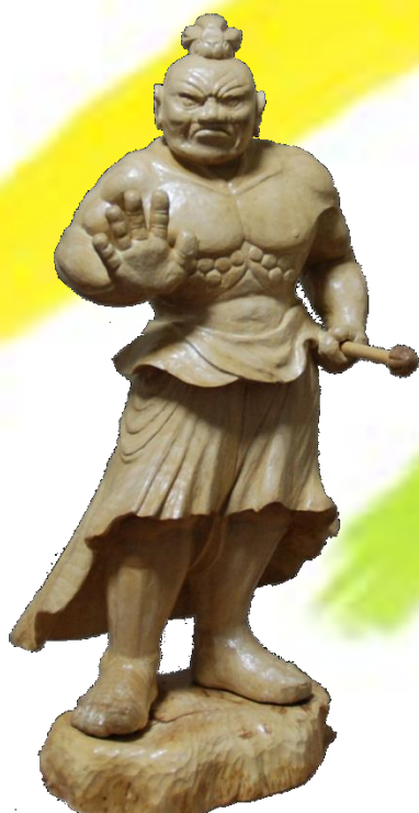
彫 刻 「金剛力士像(吽形)」 平山 司(62)