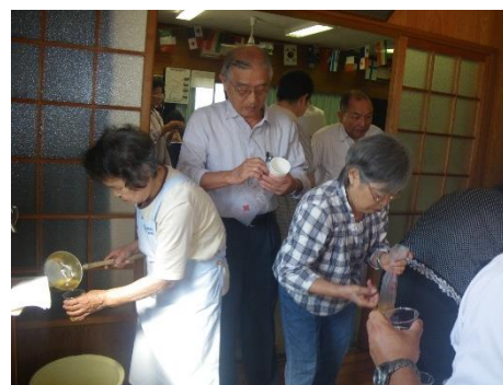
【写真】於里自治会（加治木）との合同奉仕団研修会の様子

「明るく住みよい地域づくりに貢献したい」 「誰もが住み慣れた地域で安心して暮らせるまち」を目指して、始良市加治木赤十字奉仕団では、高齢者の見守り活動や防災・救護をテーマに研修会を行なっています。 高齢者の見守り活動では、高齢者宅を訪問し安否確認だけでなく、世間話を交えて相手に寄り添うように心がけています。また年に1回昼食会を開催して交流を深めています。 この赤十字奉仕団は始良地区・蒲生地区でも同様に組織され、それぞれの地域で特色のある活動を行なっています。