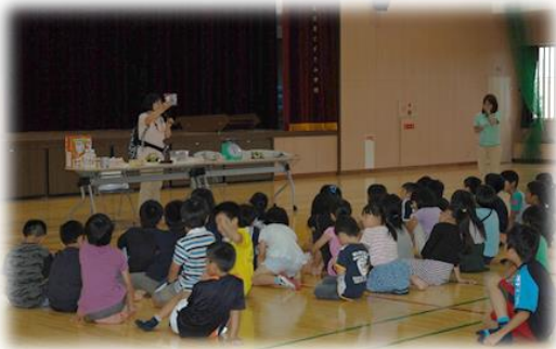
▲県防災センターの非常持ち出し品の講話（松原なぎさ小学校）