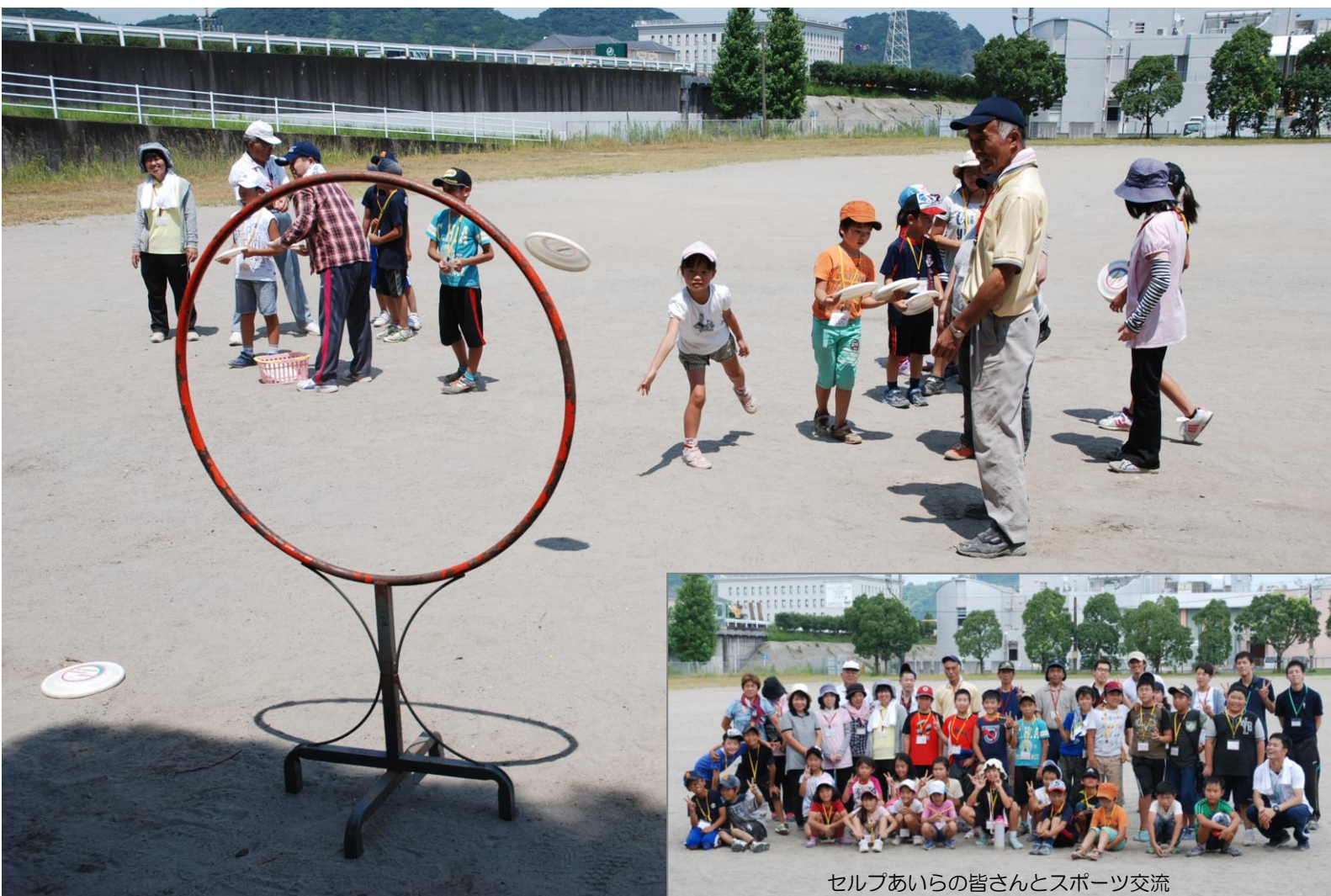
セルフあいらの皆さんとスポーツ交流

発行／社会福祉法人始良市社会福祉協議会 〒899-5432 始良市宮島町 13 番地 9 TEL0995-65-7757 FAX0995-64-5440