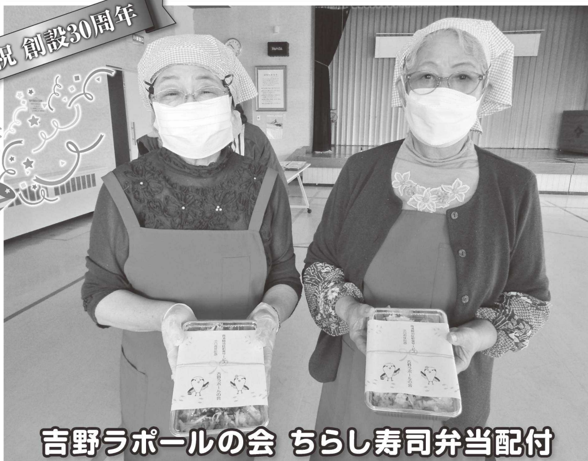
吉野ラポールの会 ちらし寿司弁当配付