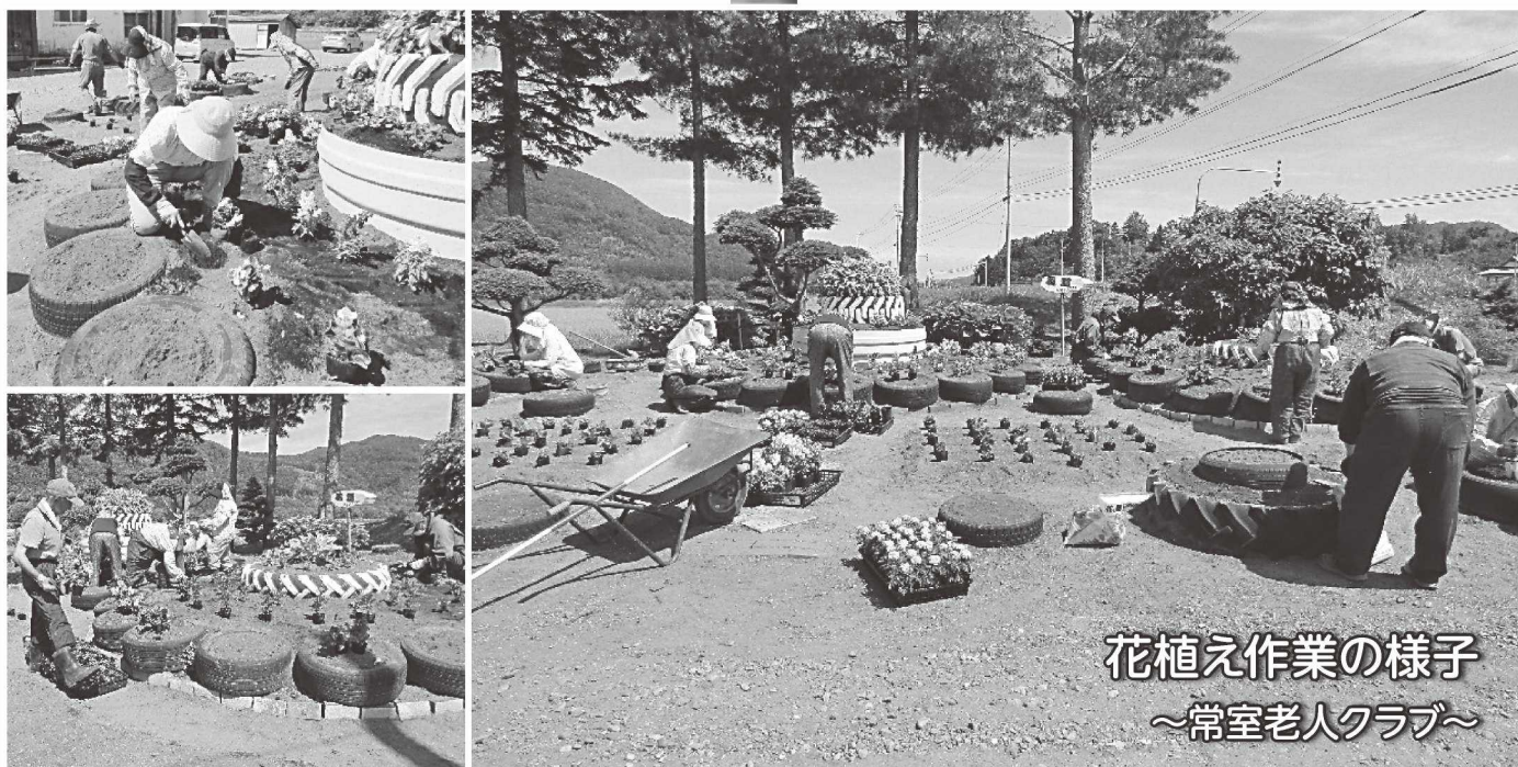
花植え作業の様子 ～常室老人クラブ～