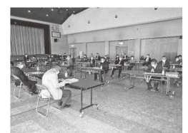
～老人クラブ連合会の事業～