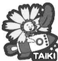
ピンバッチの デザイン

大樹町共同募金委員会では大樹町限定ピンバッチを1個500円の募金でお渡ししています。