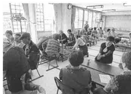
高齢者交流事業 『ふれあい♡カフェ』

高齢者交流事業 200,000円 社協だより発行事業 129,738円 地域福祉活動助成事業 40,000円 小地域ネットワーク活動支援事業 250,000円 ボランティア連絡協議会活動支援事業 100,000円 地域ふれあいサロン運営支援事業 420,000円 老人クラブ連合会活動支援事業 200,000円 身体障害者大樹分会活動支援事業 40,000円 大樹町手をつなぐ親の会活動支援事業 30,000円 青少年健全育成町民の会活動支援事業 100,000円 大樹町民生委員児童委員協議会活動支援事業 40,000円 町内小中学校活動ボランティア活動推進事業 100,000円