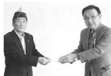
大樹ライオンズクラブ 様