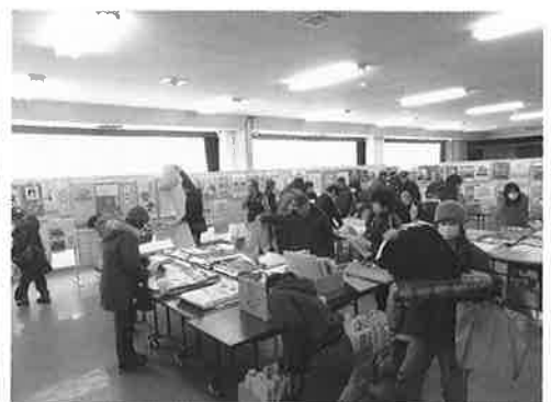
カレンダーや手帳を選ぶ様子