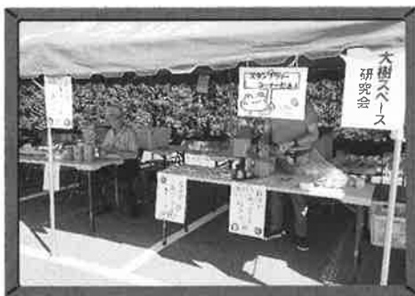
●大樹スペース研究会&味噌販売