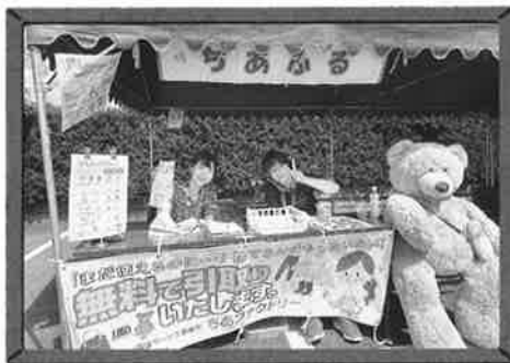
●衣類・雑貨回収コーナー