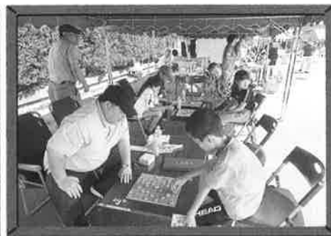
●オセロ・将棋コーナー