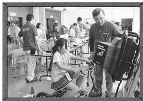
●交通安全コーナー(シミュレーター)