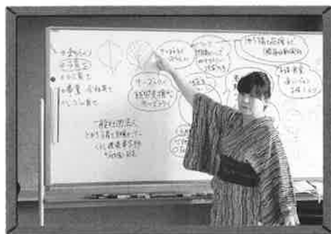
●子育て応援講演会