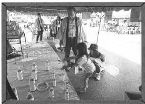
●縁日コーナー(輪投げ)