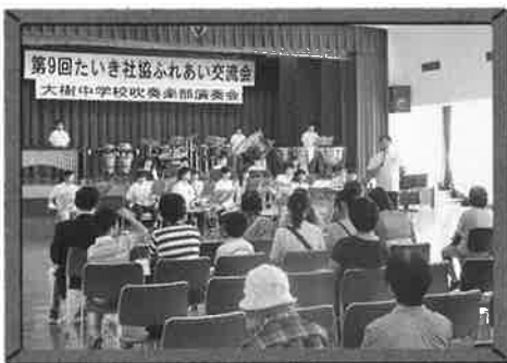
●大樹中学校吹奏楽演奏