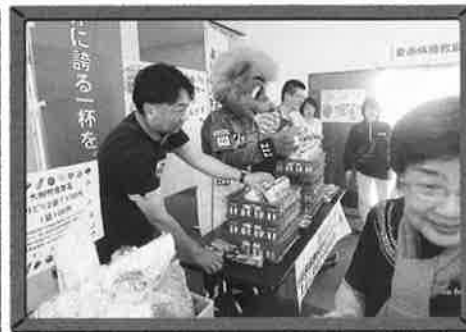
●乳製品無料配布コーナー