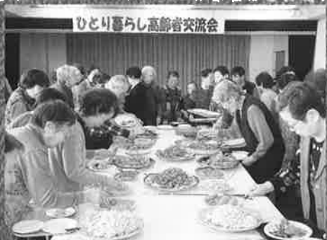
H30. ひとり暮らし高齢者昼食交流会