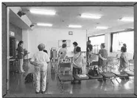
●音楽体操体験コーナー