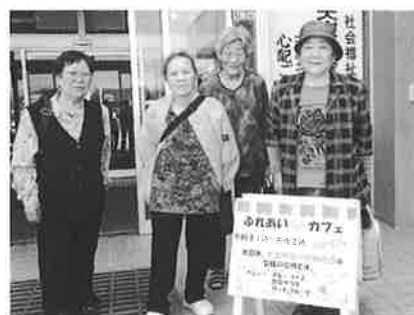
ふれサボさん手作りの看板前で記念撮影!