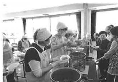
ポークとシーフードカレーどっちも食べたい!