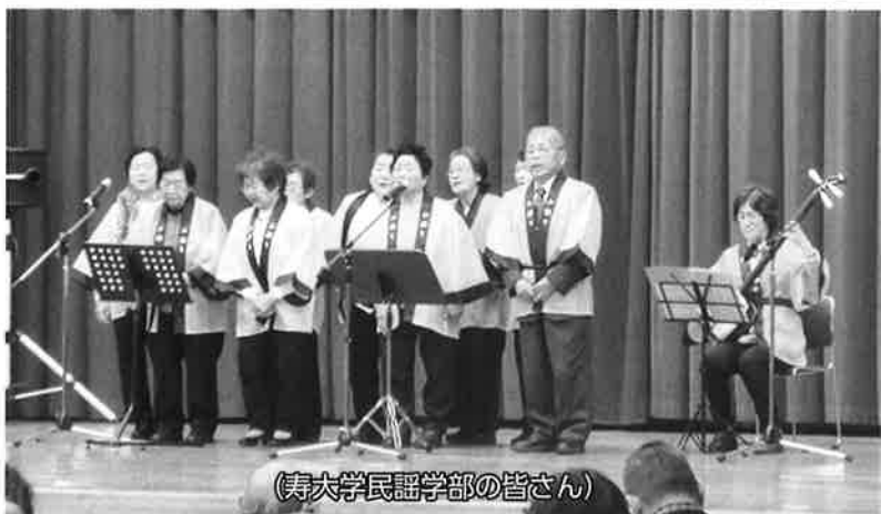
(寿大学民謡学部 of 皆さん)