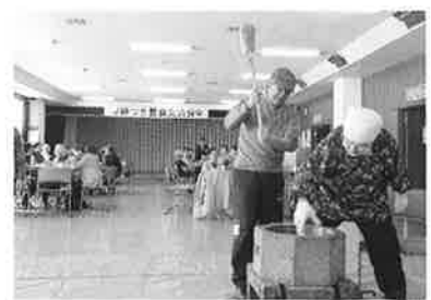
高齢者昼食交流会