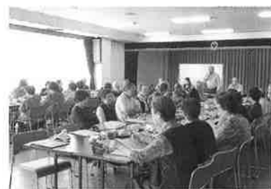
地域ふれあいサロン