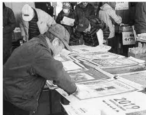
カレンダーや手帳を選ぶ様子