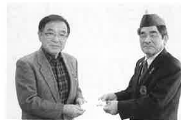
大樹ライオンズクラブ様