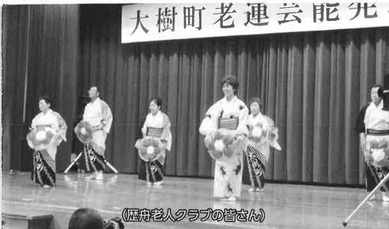
(歴舟老人クラブの皆さん)