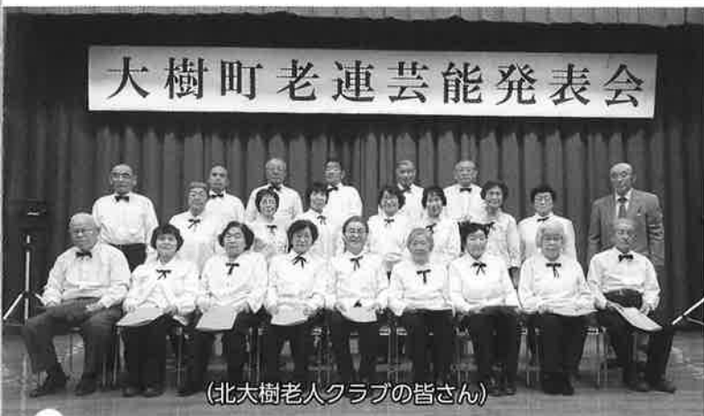
(北大樹老人クラブの皆さん)