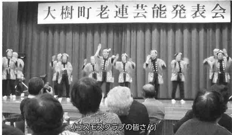
(コスモスクラブの皆さん)