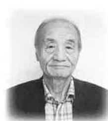
末廣会長(上)と会員の皆さん(左)