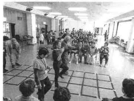
(ふまねっとクラブ 毎週水曜開催)