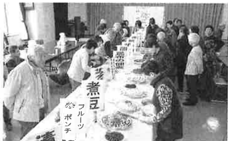
ひとり暮らし高齢者バイキング交流会(H30.3.5)