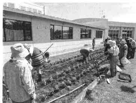
(老人クラブ特養花壇整備 H29・6・9)