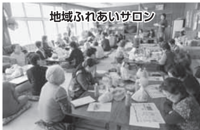
地域ふれあいサロン