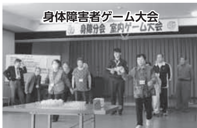
身体障害者ゲーム大会