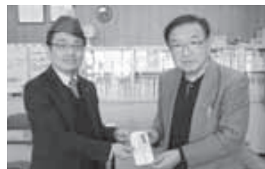
大樹ライオンズクラブ様