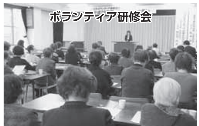
ボランティア研修会