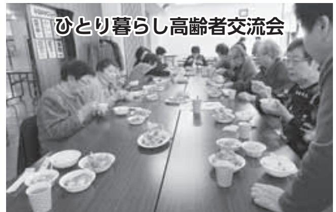
ひとり暮らし高齢者交流会