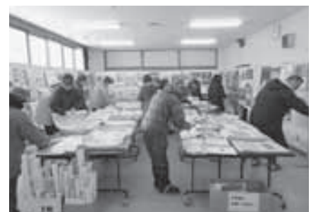
カレンダーや手帳を選ぶ様子