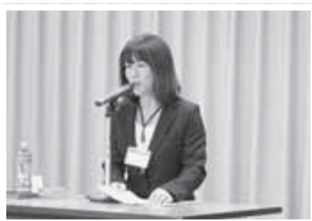
保健福祉課 明日見保健師