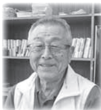
南友シニアクラブ の皆さん(左)と水 野会長