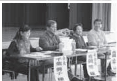
レクリエーション協会の皆さん