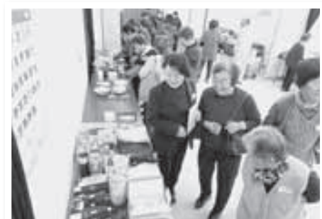
リサイクルバザーの様子(左)と参加者の皆さん