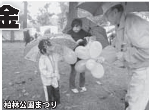
地域ふれあいサロン