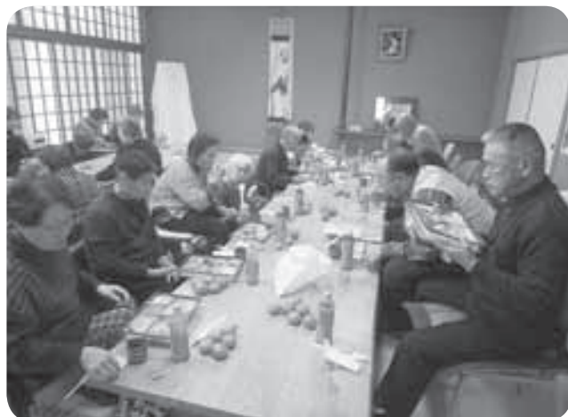
〈12／14〉 身体障害者福祉協会大樹分会の交流会が晩成温泉で行われ、29名の会員が入浴や昼食交流会を楽しみました。