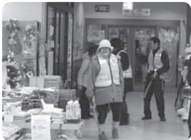
〈12／6〉 社会福祉協議会の住民活動福祉部員8名が町内各施設等を巡回する防犯パトロールを行いました。