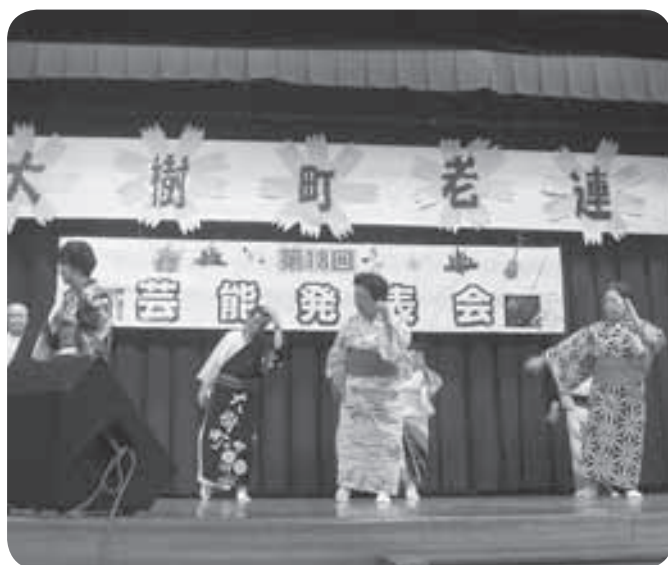
〈2 / 7〉 老人クラブ連合会主催の芸能発表会が開催され、各老人クラブから43組130名の方がこの日の為に練習した合唱、詩吟、民謡、カラオケなど様々な演目を披露し、会場から大きな声援と拍手が送られました。