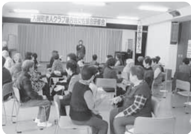
〈2／23〉 老人クラブ連合会女性部会が、レクリエーション等の研修を行い、各老人クラブから45名の会員が参加しました。