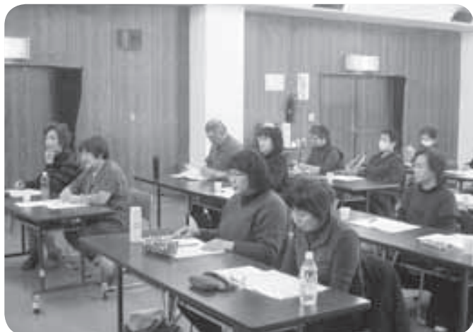
〈12／2〉 日常生活で支援が必要な方が住み慣れた地域でいつまでも安心して暮らせるように、地域ふれあいサポーター養成講座を開催致しました。