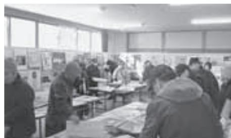
カレンダーや手帳を楽しみながら選ぶ様子