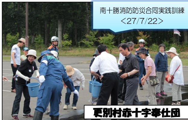
更別村赤十字奉仕団