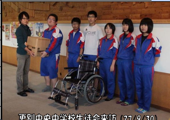
更別中央中学校生徒会来訪 (27/9/30)