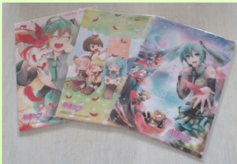
↑ 初音ミク クリアファイル