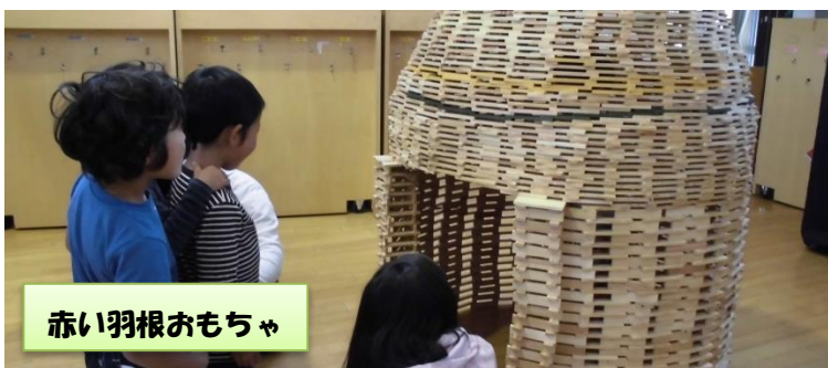
赤い羽根おもちゃ

12月からは、国・県・市町村などのための「歳末たすけあい運動」が始まります！よろしくお願いします。