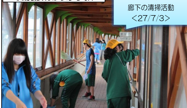
シルバーハウジング 廊下の清掃活動 <27/7/3>