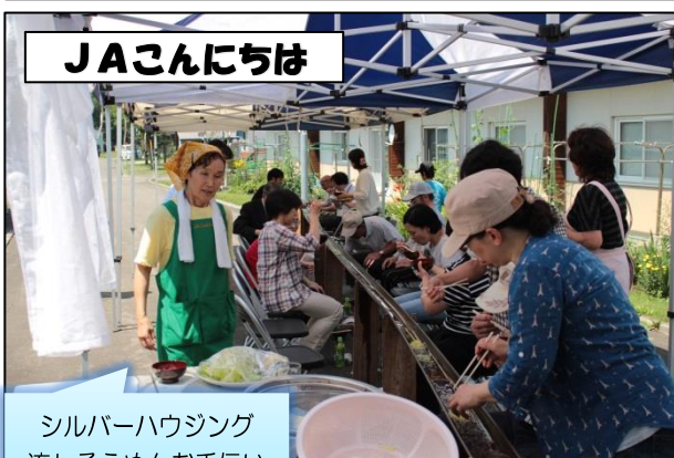
シルバーハウジング 流しそうめんお手伝い <27/7/29>