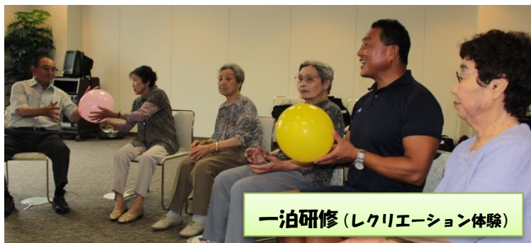
一泊研修（レクリエーション体験）