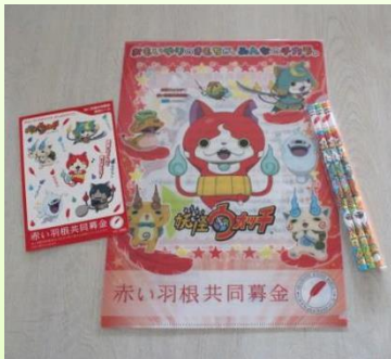
↑ クリアファイル、シール、えんぴつ