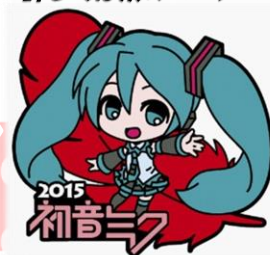
illustration by nekosumi © Crypton Future Media, INC. www.piapro.net piapro