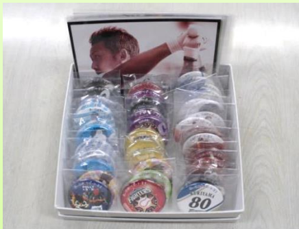
↑ ファイトース ポストカード、ピンバッチ