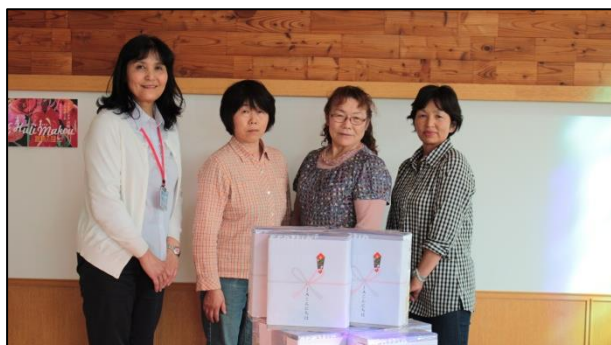
ボランティアグループ JA こんにちば 来訪 <27/6/29>