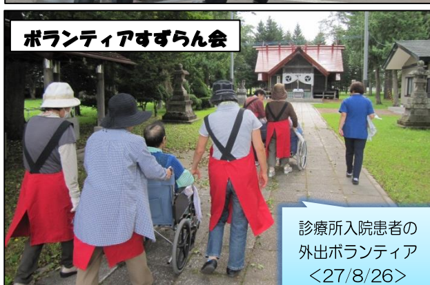
診療所入院患者の 外出ボランティア <27/8/26>