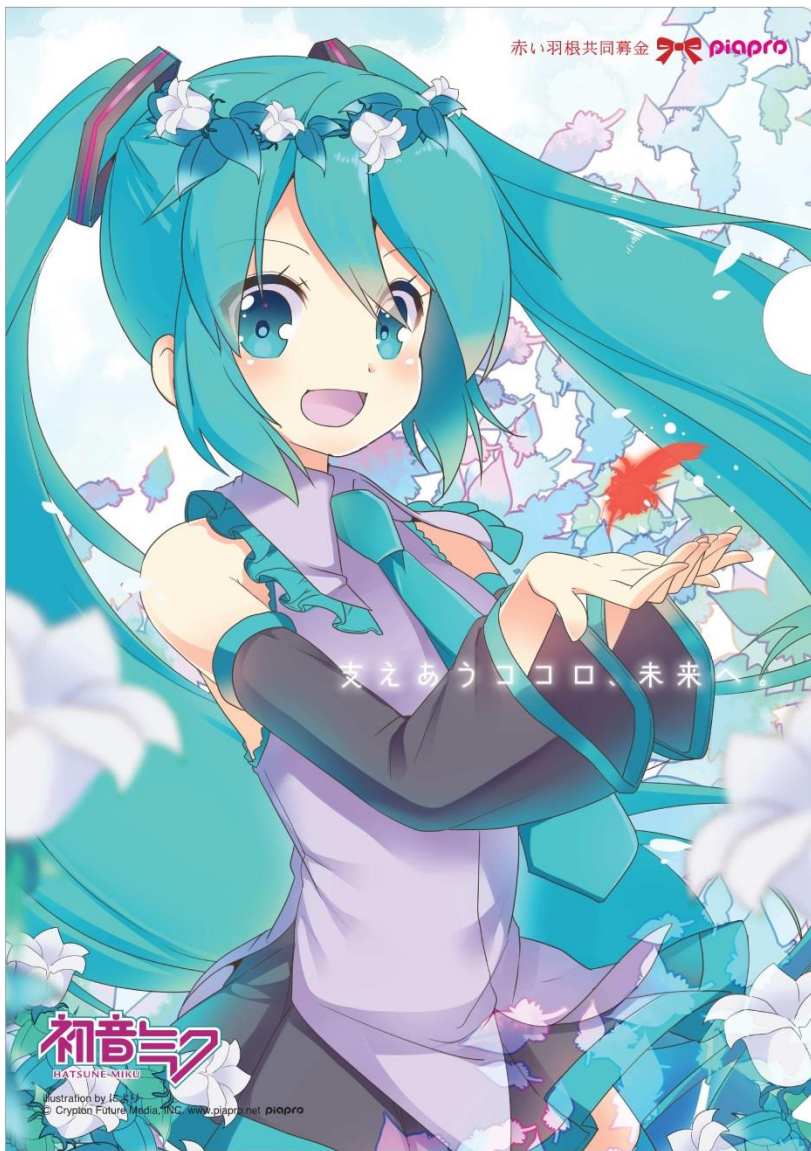
illustration by により

© Crypton Future Media, INC. www.piapro.net piapro