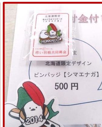
北海道シマエナガ・ピンバッチ

更別村共同募金委員会では、老人保健福祉センター (福祉の里温泉) の窓口にて、北海道限定の赤い羽根寄付金付きグッズを取り扱っています。