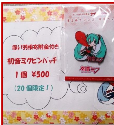
初音ミク・ピンバッチ