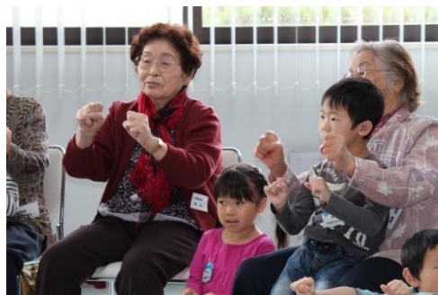
↑ 幼稚園児との交流（26/5/9）