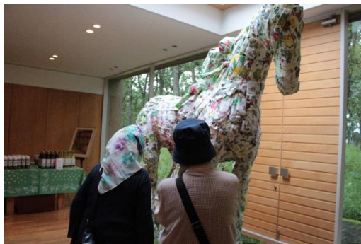
六花亭中札内美寿部術村へ（26/8/22）↑