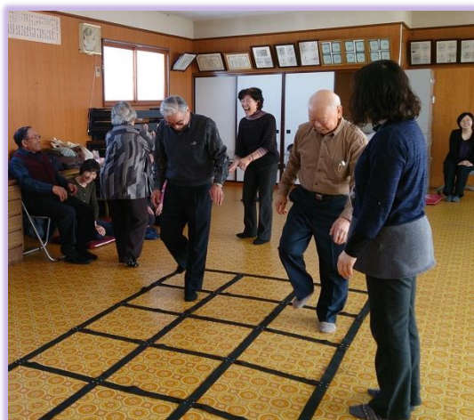
↑ 勢雄老人クラブ柏寿会での出張教室 (26/2/20)

また、地区の会合や学校の授業等、出張教室にも伺いますので、お気軽にお問い合わせください。(☎53-3500)