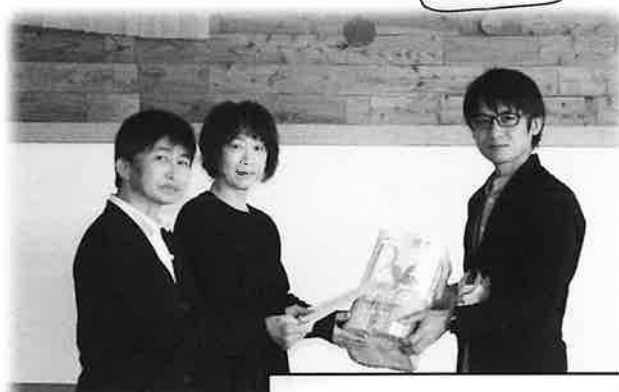
JA さらべつ女性部 様