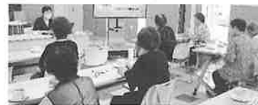
さらべつ 介護カフェ