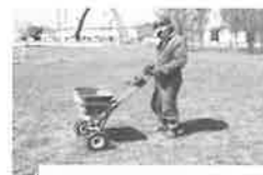
会員による作業(防除)