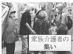
家族介護者の 集い