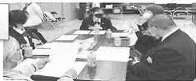
更高中生と 話そう会