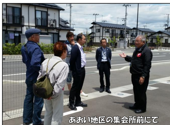
あおい地区の集会所前にて

平成29年6月3日（土）～6日（火）、社協役職員・評議員に地域代表者（公募）を加えた5名で福島県と宮城県へ行ってまいりました。