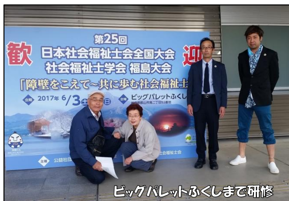
ビッグパレットふくしまで研修