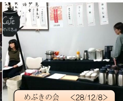
めぶきの会 <28/12/8> “支え愛フォーラムにて喫茶”