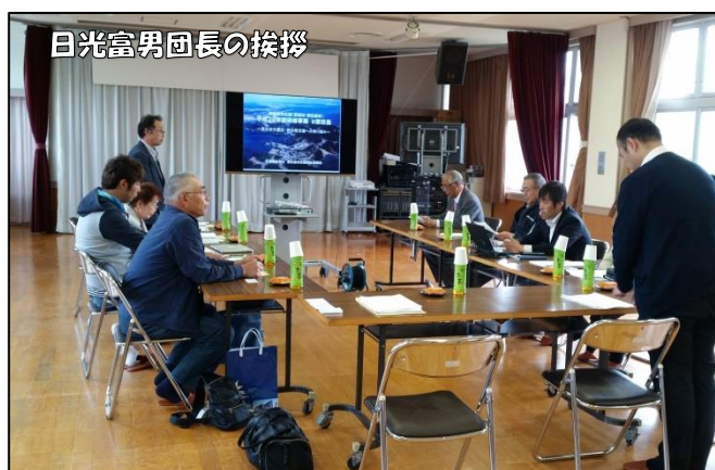
日光富男団長の挨拶

この貴重な機会と大切なつながりを更別村の福祉・防災に活かすと共に、東松島市社協との絆をこれからも深めていきます。