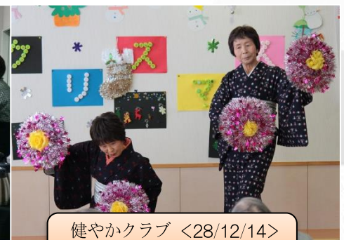
健やかクラブ <28/12/14> “診療所クリスマス会”