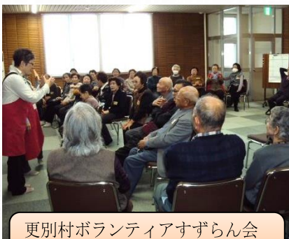
更別村ボランティアすずらん会 “ふれあい昼食会” <28/12/5>