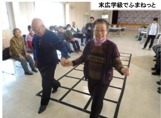
末広学級でふまねっと