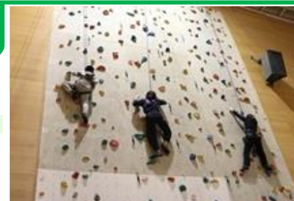
↑ 施設見学&体験ツアー

事故等に繋がる恐れのある危険個所の点検及び改善。自動販売機(有害図書等)の設置の有無、有害広告物ほか