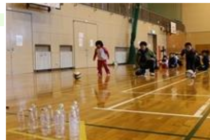
↑ えりも遊びリンピック