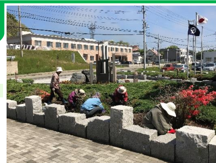
↑(上) 役場庁舎花壇整備の様子

平成3年に発足され、現在、会員12名で活動しています。「無理をせず、相手の喜びを糧に、楽しんで活動することを心がける。」これを会のモットーとして活動をしています。