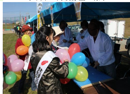
↓(下) 街頭募金の様子