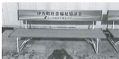
町内での使い道 公園等へのベンチ設置など