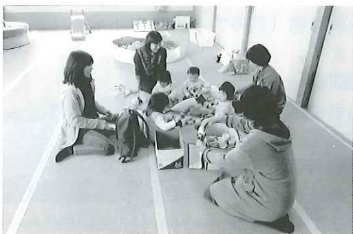
『ふれあい・子育てサロン』の様子