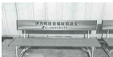
町内での使い道 公園等へのベンチ設置など