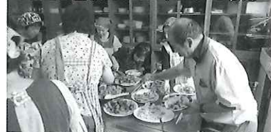
調理実習後のバイキングの様子

精神保健ボランティアグループ「なぎさ」の主催により、障害者当事者同士でゆっくりとお話をしたり、交流する場を設けています。「話し相手が欲しい」、「何か楽しみをみつきたい」、「外に出るきっかけが欲しい」という方、一緒に色々な活動に参加してみませんか。お気軽にお越しください。