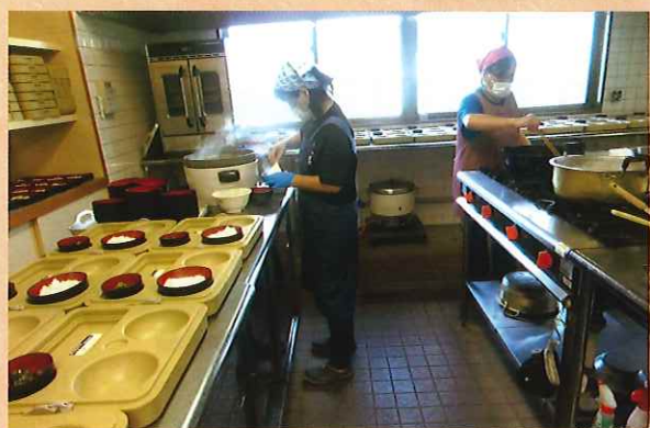
デイサービスの調理員が心を込めて作っています。