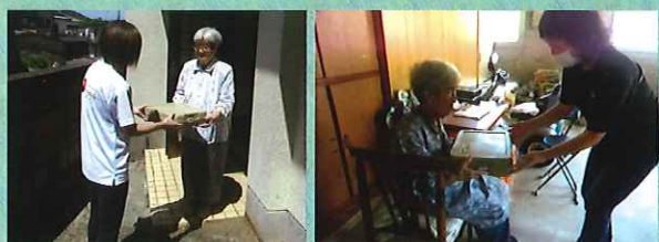
社会福祉協議会の職員が自宅までお届けします。