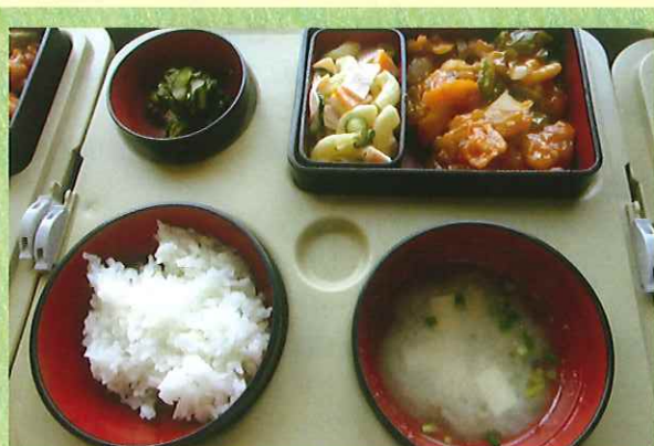
お届けするお弁当です。献立は毎回変わります。