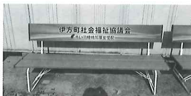
町内での使い道 公園等へのベンチ設置など