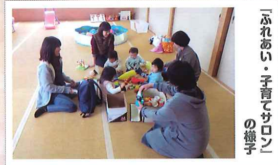
『ふれあい・子育てサロンの様子』