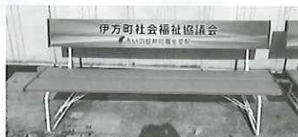
町内での使い道 公園等へのベンチ設置など