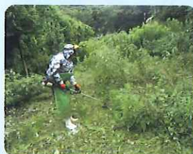
草刈り作業の様子 (伊方地区)