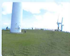
風の丘パーク清掃の様子 (瀬戸地区)