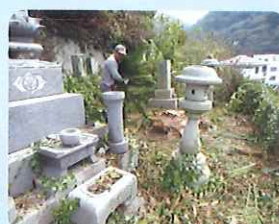
お墓掃除の様子 (三崎地区)