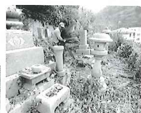
お墓掃除の様子 (三崎地区)