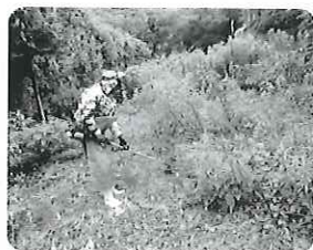
草刈り作業の様子 (伊方地区)