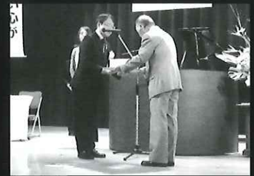
社会福祉協議会会長表彰 【民生委員・児童委員功労表彰】

令和元年11月9日(土)伊方町民会館大ホールにおいて、保健、医療、福祉が連携をすすめ、「健やかで、あたたかい心がふれあうまちを目指して」関係者の理解と連携強化を促進し、町民の福祉向上を目的として開催いたしました。