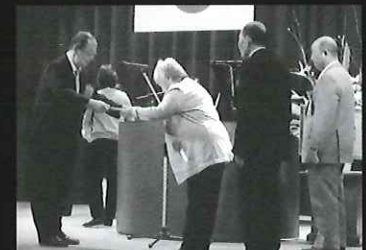
社会福祉事業功労者 知事表彰

オレンジ作業所、作業所ふれあい岬、ワークいかたによる展示・即売会や福祉用具等の展示もあり、たくさんの人で賑わいました。