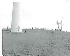
風の丘パーク清掃の様子 (瀬戸地区)