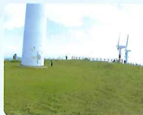
風の丘パーク清掃の様子 (瀬戸地区)