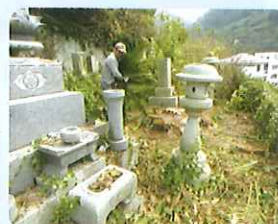
お墓掃除の様子 (三崎地区)