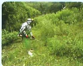
草刈り作業の様子 (伊方地区)