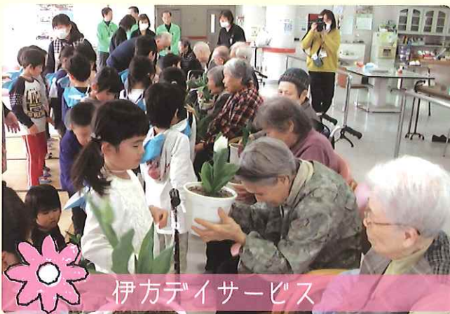
伊方デイサービス