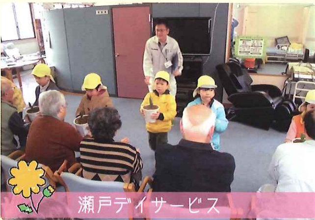
瀬戸デイサービス

各デイサービスセンターに町内の保育園児が丹精込めて育てたチューリップの花をいただきました。