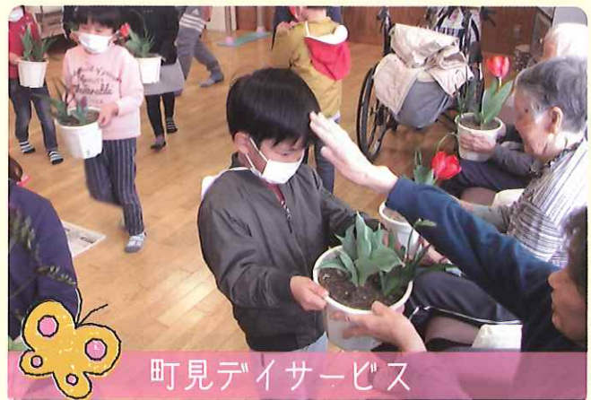
町見デイサービス