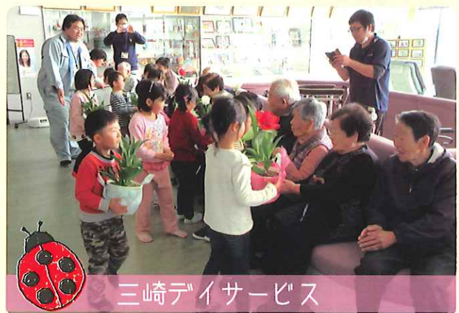
三崎デイサービス