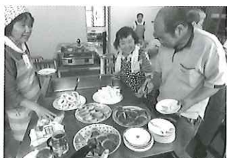
調理実習後の バイキングの様子

「話し相手がほしい」、「何か楽しみをみつきたい」、「外に出るきっかけが欲しい」という方、一緒に色々な活動に参加してみませんか。お気軽にお越し下さい。