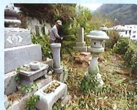
お墓掃除の様子 (三崎地区)