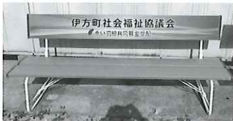
町内での使い道 公園等へのベンチ設置など