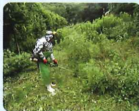
草刈り作業の様子 (伊方地区)