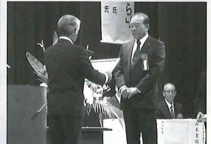
伊方町の地域福祉活動に積極的に協力・援助された団体に対する感謝