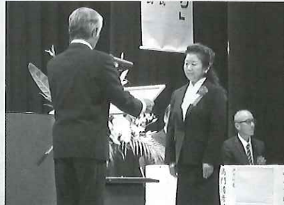
伊方町の地域福祉活動に積極的に協力・援助された個人に対する感謝