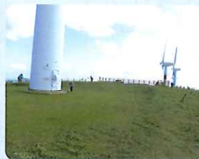
風の丘パーク清掃の様子 (瀬戸地区)