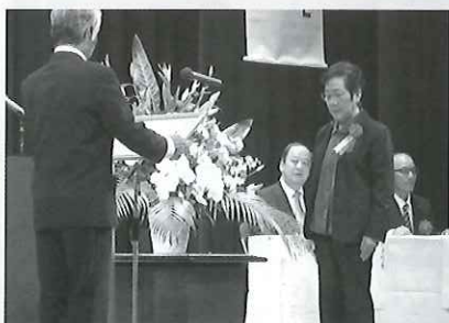
伊方町の地域福祉活動に貢献された主任児童委員に対する表彰