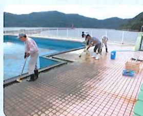
プール清掃の様子 (瀬戸地区)