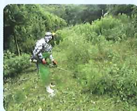
草刈り作業の様子 (伊方地区)