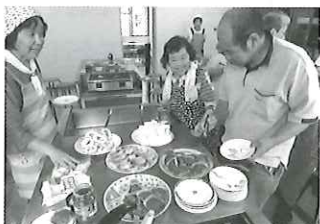
調理実習後の バイキングの様子

「話し相手がほしい」、「何か楽しみをみつきたい」、「外に出るきっかけが欲しい」という方、一緒に色々な活動に参加してみませんか。お気軽にお越し下さい。