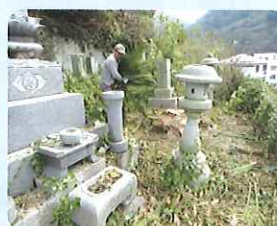
お墓掃除の様子 (三崎地区)