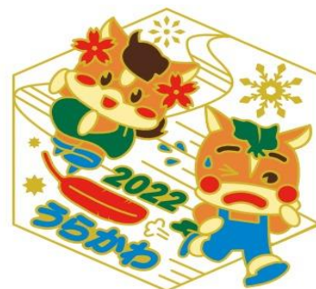
〔2022年版 ピンバッジデザイン〕

皆さまよりお寄せいただきました寄附金をもとに、赤い羽根の共同募金会から様々な福祉活動を実施する各社会福祉施設・団体等に「助成」という形で資金支援されます。共同募金の助成対象分野は、「社会福祉事業」と「更生保護事業」です。つまり、お年寄りや障がいのある方、子ども達の福祉などを支援するための活動など、共同募金はみなさまの身近なところで活用されることとなります。このように、共同募金は様々な「カタチ」で、私たちの身近な福祉活動を支えておりますので引き続き、ご支援・ご協力をお願いいたします。