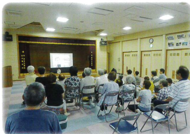
田後地区コミュニティセンター

岩美町社会福祉協議会では日本財団助成金を活用し、高齢になっても地域で安心して暮らし続けられるまちづくりを目的として、インターネットを活用したテレビ電話で地域をつなぐ新たなコミュニティーの仕組みであるテレビ会議システム【愛称：楽集ネットワーク】を構築し、平成29年度より運用しています。 そして、令和元年度よりこのネットワークの一つの取り組みである岩美病院の健康相談を、それぞれの地区に拡充するため、参加を希望する地域に必要な機材を無償で貸し出し、身近な場所ですべての健康相談が受けられる体制を整備する取り組みを行っています。 貸し出し可能なのは、町内9か所の地区公民館で、1回につき1地区限定ですが、お気軽にお申し込みください。